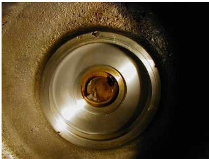
モーター側（シャフト折損）