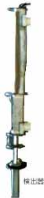
伊方1, 2号機放水口水モニタ設置状況