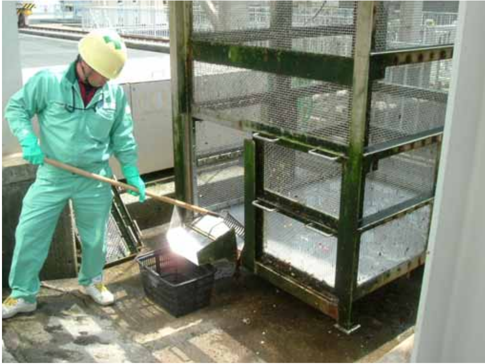
除塵装置の清掃作業