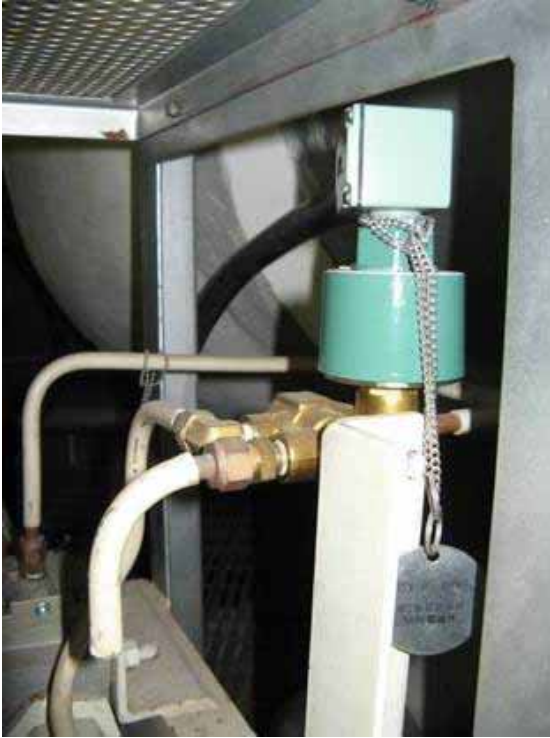
抽気逆止弁駆動用電磁弁