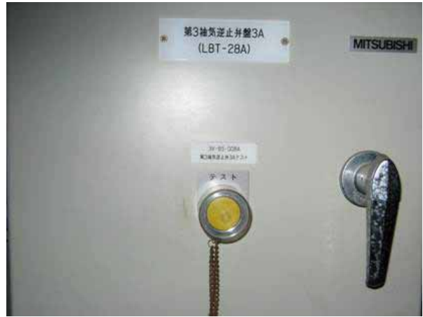
テスト用スイッチ