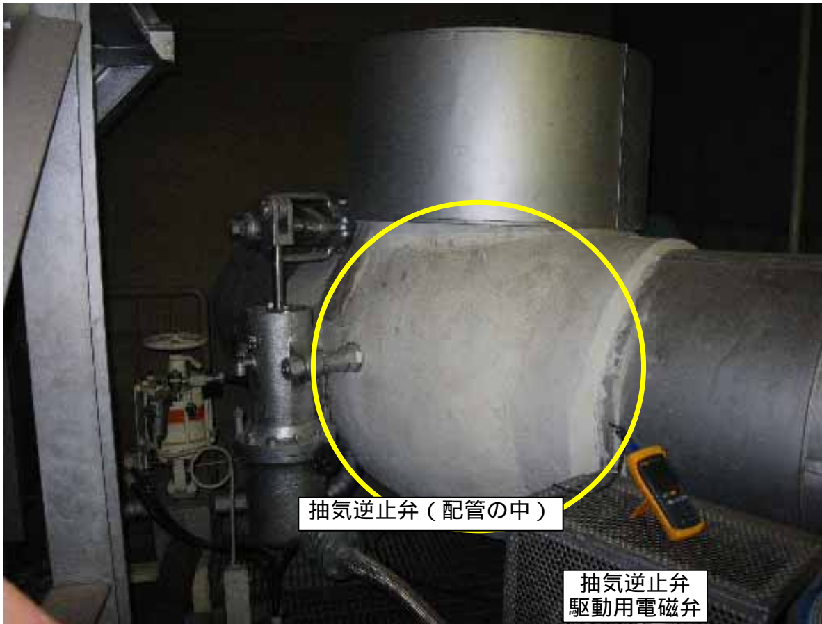
抽気逆止弁（配管の中）